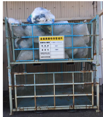
●プラごみの産廃処理表示