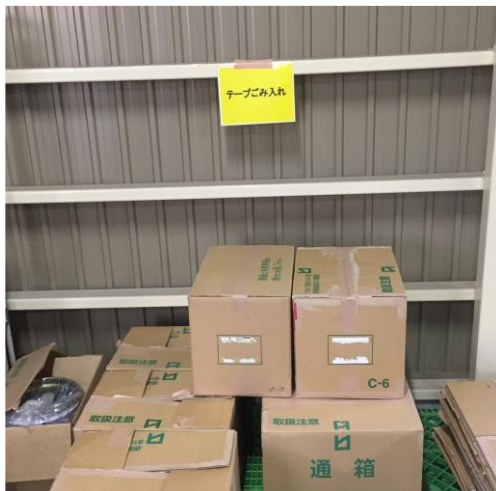
●テープごみのリサイクル