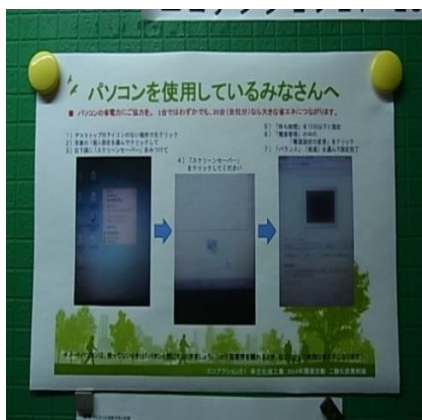
●使用済みコピー用紙再利用の徹底表示