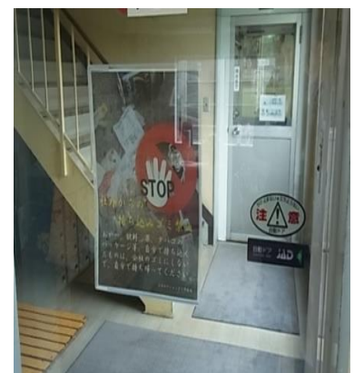
●社内からの持込みゴミ廃棄禁止の表示