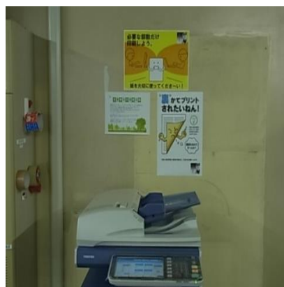
●ミスコピーの防止の表示 ●PC・プリンター省エネ設定